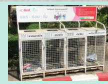
คังแคชชะ/ 3R