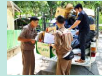
ธนาคารชะ (Green Heart Bank)