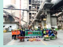
Big Cleaning Day/ 5a/Kaizen