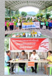
อินทรีอาสา / หน่วยแพทย์เคลื่อนที่