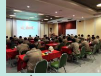
สื่อสาร/อบรม ด้านสิ่งแวดล้อม