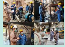
SOT/ KYT/Hazard Report/Safety Passport