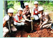
ปลูกต้นไม้เพิ่มพื้นที่ สีเขียวในโรงงาน