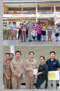
โครงการหมู่บ้านสีเขียว