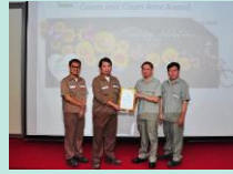
โรงงานสีเขียว และสะอาด