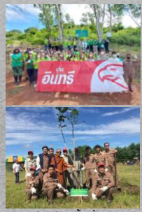
ปลูกต้นไม้ในพื้นที่ชุมชน