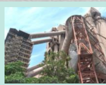
ลดการใช้พลังงานไฟฟ้า